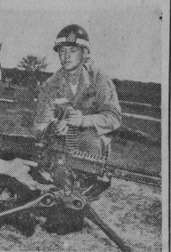
Minister „obrony” Korci Podwójny i Kim Yong Woo przy lekkim karabinie maszynowym podczas wizyty w Ft. Benning w stanie Georgia (USA), gdzie zaznajomili się ze szkoleniem i bronią piechoty amerykańskiej. CAF