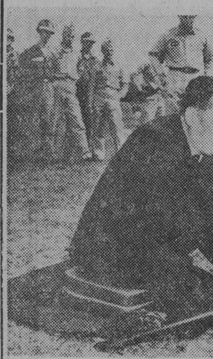
Minister „obrony” Korci Podwójny i Kim Yong Woo przy lekkim karabinie maszynowym podczas wizyty w Ft. Benning w stanie Georgia (USA), gdzie zaznajomili się ze szkoleniem i bronią piechoty amerykańskiej.