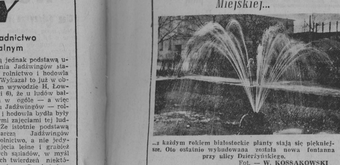
...z każdym rokiem białostockie planty stają się piękniejszą. Oto ostatnio wybudowana została nowa fontanna przy ulicy Dzierżyńskiego.