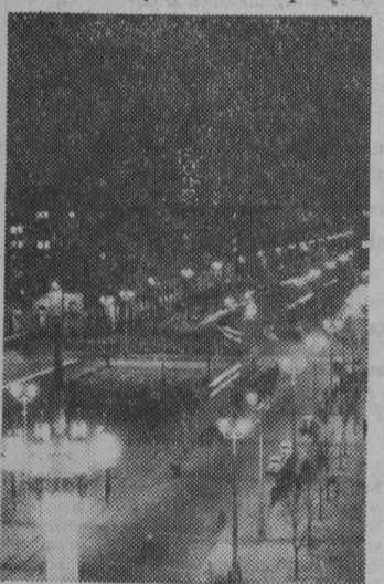
NA ZDJĘCIU: Marszałkowska Dzielnica Mieszkankowa. Plac Konstytucji. CAF — fot. Baranowski