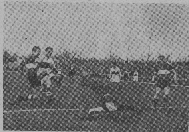
NA ZDJĘCIU: fragment spotkania Gwardia (Warszawa) — Salgotarian (Węgry) 2:0.