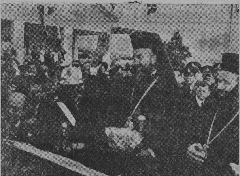
NA ZDJĘCIU: arceybiskup Makarios pozdrawia tłumy Ateńczyków, witając go na drodze z lotniska.