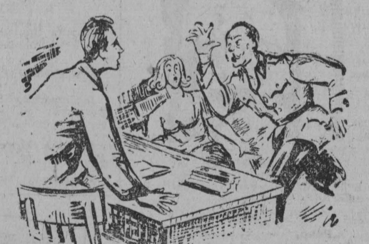
Wpadł do pokoju profos, cały czerwony... — Kapitanie! Gabel nie żyje!