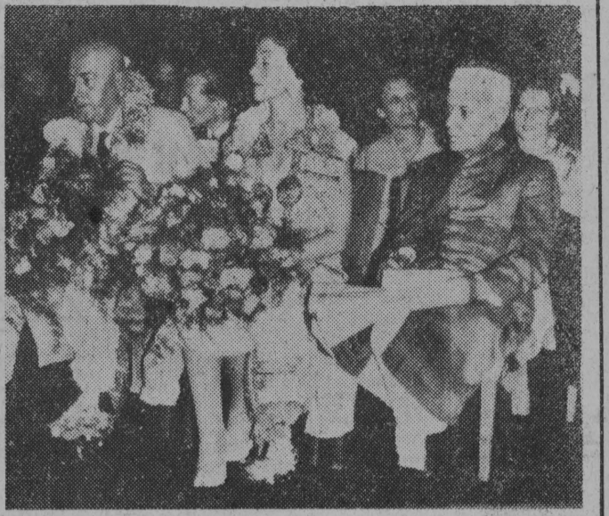
New Delhi. W parlamencie Republiki Indii.