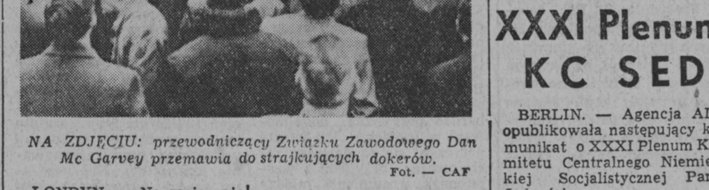
Strajk w Anglii trwa Ze stoczniovcami solidaryzują się górnicy