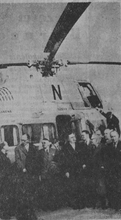
Pierwsze helikoptery „Sikorski” Belgijskiego Towarzystwa Lotniczego Sabena na linii Bruksela — Paryż — Bruksela, wylądowały niedawno na lotnisku w Issy-les-Moulineaux, na przedmieściu Paryża. NA ZDJĘCIU: grupa belgijskich osobistości oficjalnych, która przybyła pierwszym helikopterem.

Pasażerskie helikoptery na trasie Bruksela-Paryż