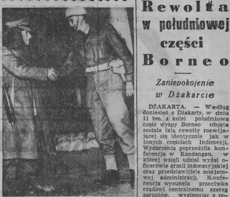
Zolnierz indonezyjski wymienia przed oddziałem uścisł dłoń z żołnierzem wojsk ONZ.

Wzrost napięcia w strefie Gazy KAIR. — Radio kairskie donosi ustawnie o gwałtownych demonstracjach ludności arabskiej w strefie Gazy i o wzrastającym napięciu między mieszkańcami miasta a oddziałami międzynarodowych sił policyjnych. Główni zainstalowani na miejscu według radia kairskiego — ustawicznie nadają informacje w sprawie ludności do spokoju i podaje adresy, gdzie, że oddziały ONZ pozostawiają w Gazie czasowo.