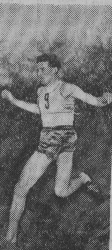
Krzyszkwiał też rozpoczął od przelajów. Obecnie są one jego ulubionym dystansem.

Dziś trzeba przelać im należą im rangę atrakcyjnej, samodzielnej dyscypliny i podstawić wytrzymałościowego treningu przede wszystkim lekkoatletów i piłkarzy, hokeistów i narciarzy. Za przelajami przemawiają rozsądek, no i z samej natury względy ambicji, emocji.