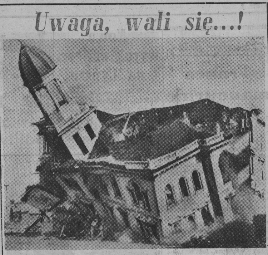
Uwaga, wali się...!