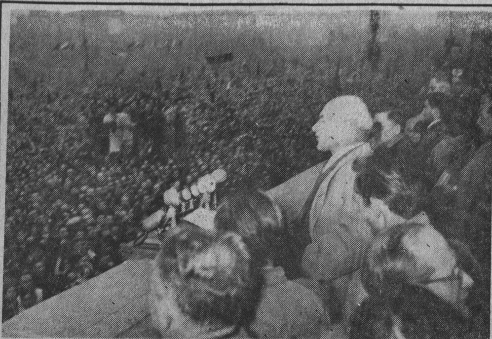
Tow. W. Gomułka przemawia na spotkaniu kierownictwa partii z ludem Stolicy.

Tak to właśnie zrozumiały załogi białostockich zakładów. W Białostockich Zakładach Roszarniczych wczoraj do godz. 12 w południe wykonano 110 proc. normy dziennej. W Zakładach Naprawy Sprzętu Drogowego plany dzienne reali-