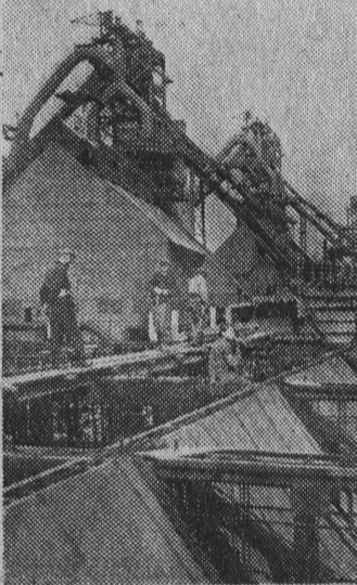
Huta im. Lenina

Jednym z wielkich obiektów, które w planie 5-letnim ulegną dalszej rozbudowie jest Kombinat Hutniczy im. Lenina w Nowej Hucie.