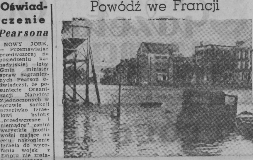
Powódź we Francji

NOWY JORK. — W miejscowości Knoxville (Stan Tennessee) odbywał się koncert muzyki jazzowej w wykonaniu światowej sławy zespołu Luisa Armstronga.