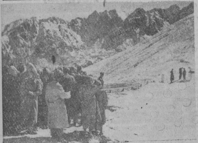
CAF — fot. Werner