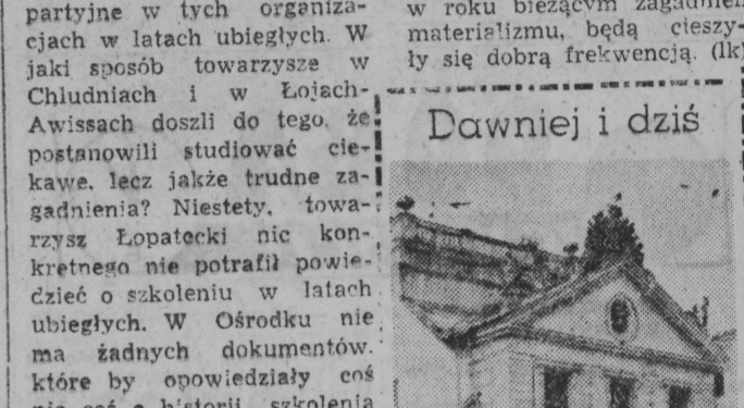
Dawniej i dziś. Pałac, który widzimy na zdjęciu, początkowo był własnością magnatów Osadowskich...