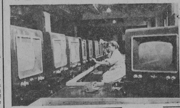
W Związku Radzieckim już kilkakrotnie obniżono wydatnie ceny telewizorów różnego typu.

NA ZDJĘCIU: kontrola nowych odbiorników telewizyjnych w dziale kontroli technicznej w Moskiewskiej Fabryce Aparatów Radiowych.