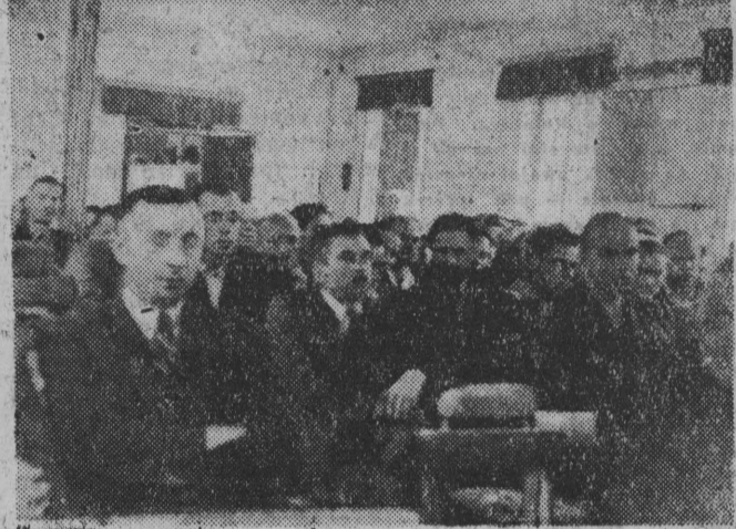
Wielu nauczycieli przybyło z całego kraju...