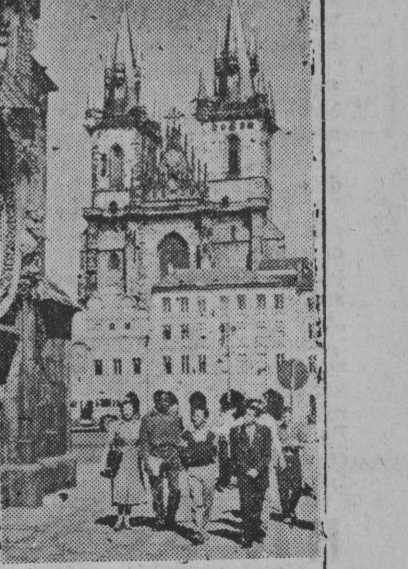
26 sierpnia br. rozpoczęła się w Pradze obrady IV Światowego Kongresu Studentów.

Wszystkie budynki postawione są z gliny. Obora i jeden dom mieszkalny wybudowano rok temu. Oba Ludyni trzymają się pierwszorzędnie i nie ma na nich wad. Obecnie w Burbińskich buduje się dwa dalsze domy mieszkalne także z gliny.