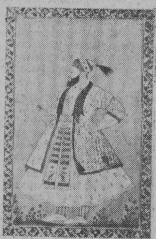
Portret Abul Hasana. Miniatura z XVII wieku.

Prawdziwą chlubą szkoły bengalskiej była zmarła w