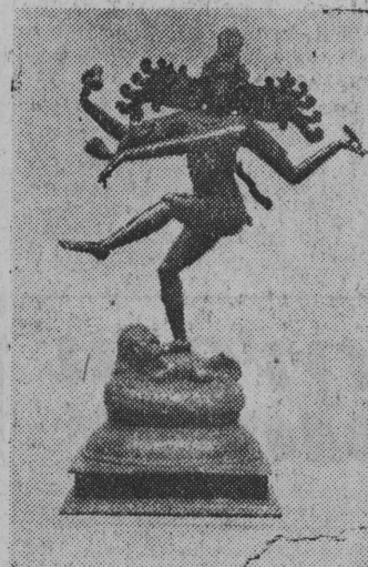
Posąg bogini Natesz (X—XI wiek)

dniu 1 września: boisko Gwardii, Gwardia B-stok — Kolejarz Łapy (godz. 16); boisko LZS, LZS Uhowo — LZS Choroszcz (16); boisko Kolejarza, Start Białystok — LZS Klepacz (14); boisko Kolejarza, Victoria B-stok — Start Supraśl (16); boisko Skry, Skra Czarna Wieś — Ognisko B-stok (16); boisko wojskowe na Nowym Mieście, LZS Dojlidy — Pegoń Wasilków (14).