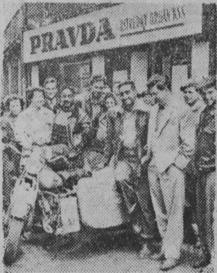
NA ZDJĘCIU: studenci hinduscy w Bratysławie (CSR)

których przejechali dwaj turyści hinduscy. Motocykl często otaczali mieszkańcy Moskwy pragnący zapoznać się z przybyszami z Indii.