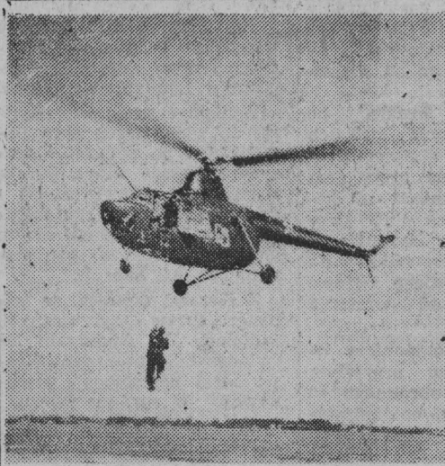
NA ZDJĘCIU: pasażer śmigłowca, który wręczył po wylądowaniu kwiaty Premierowi Cyrankiewiczowi, wchodzi po drabince do kabiny.