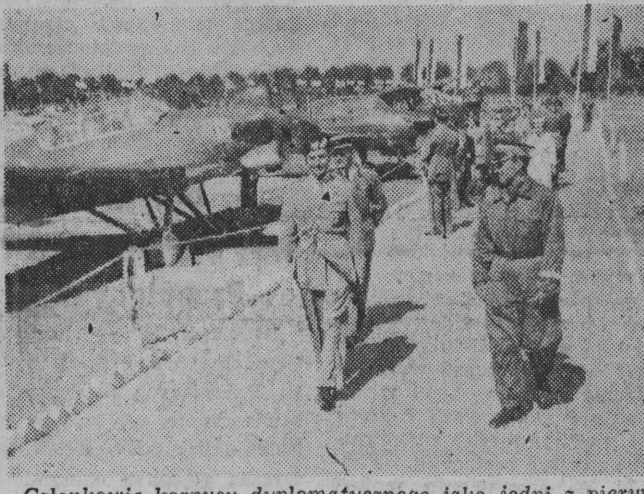
Członkowie korpusu dyplomatycznego jako jedni z pierwszych zwiedzili wystawę sprzętu lotniczego otwartą w dniu 26 sierpnia br. na lotnisku „Okęcie” w Warszawie.

W związku z uroczystościami z okazji Miesiąca Pogłębienia Przyjaźni Polsko - Radzieckiej wyjedzie do ZSRR wieloosobowa delegacja przedstawicieli społeczeństwa polskiego.