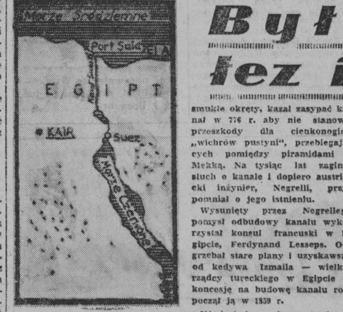
Mapa Kanału Sueskiego