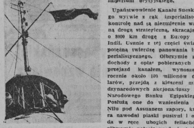
NA ZDJĘCIU: flaga egipska na siedzibie Towarzystwa Kanału Sueskiego w Port Suid.