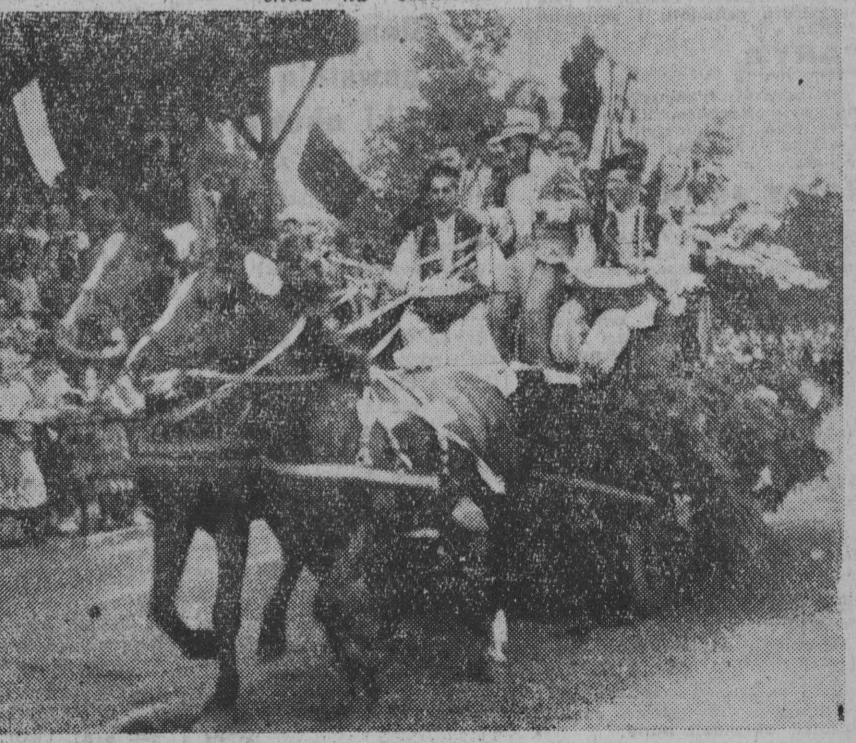
Pięknie udekorowany wóz otwiera pochod na stadionie.

Zbliża się godz. 10. Na Rynek Kościuszki wjeżdża dwaj trabacze, a tuż za nimi pomysłowo udekorowany dyliżans „Herold” ogłasza „wzajemnie” że dziś w naszym mieście, odbywa się wielki festyn. Kto żywności widzi ze swojego domu i weźmie udział w tym spotkaniu młodzieży.