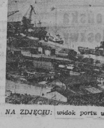
NA ZDJĘCIU: widok portu w Rostocku (NRD).