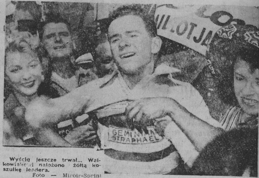
Wyciąg jeszcze trwał... Walkowiako! nałożono złotą koszulkę lidera.

Wspaniałym sukcesem kolarza polskiego pochodzenia Rogera Walkowiaka zakończył się tegoroczny Tour de France, rozegrany na 22 etapach o łącznej długości 4.509 km. Ten 29 letni kolarz polskiego pochodzenia wygrał bezapelacyjnie Tour de France — największy wieloetapowy wyścig dla kolarzy zawodowców, aczkolwiek w końcowej klasyfikacji tylko o 1,25 sek. wyprzedził swego najgroźniejszego rywala Francuza Bauvina. Końcowy czas Walkowiaka wynosi 124.01.16, a Bauvina — 124.02.41. Trzecie miejsce zajął Belg Adriaenssens — 124.05.00.