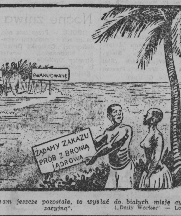
„Jedyna możliwość, jaka nam jeszcze pozostała, to wysłać do białych misję cywilizacyjną”