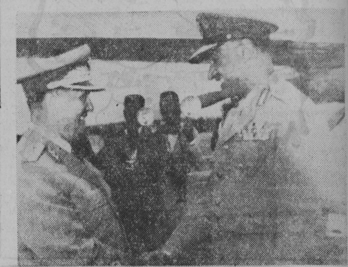
Na wyspie Brieni. Rozmowy Tito-Nehru-Nasser

GA ZDJECIU: prezydent Nasser wygłasza serdeczny uścisk dłoni z prezydentem Jugostawii J. Broz-Tito.