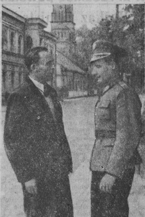
W dniu 7 października obchodzimy w naszym kraju 11 rocznicę powołania Milicji Obywatelskiej.

„Tegoroczne plony ziemniaków... Ciąg dalszy na str. 2