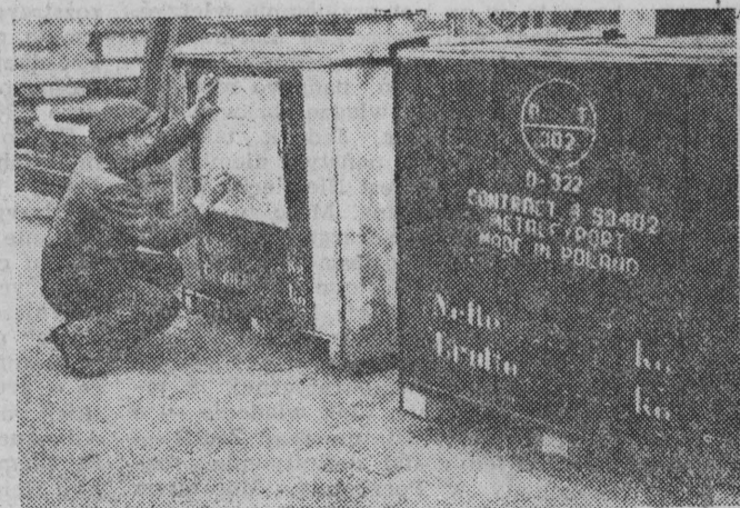
Swidnicka Fabryka Urządzeń Przemysłowych produkuje między innymi specjalnie na zamówienie Chińskiej Republiki Ludowej aparaty służące do wyposażania cukrowni. NA ZDJĘCIU: skrzynie z urządzeniami produkcji polskiej wkrótce wyruszą w daleką podróż do Chin.