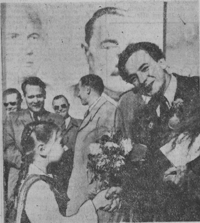
W Kuźnicy, gdzie odbył szkółki podstawowej w Kucie wielki Festyn Przyjaźni, żniacy wręcza kwiaty kierownikowi drużyny motocyklistów białoruskich z stów Białorusi, Kulenkiw-DOSAAF Mińsk. NA ZDJĘCIU: uczennica.

W czwartek półfinały turnieju „dzikich” drużyn