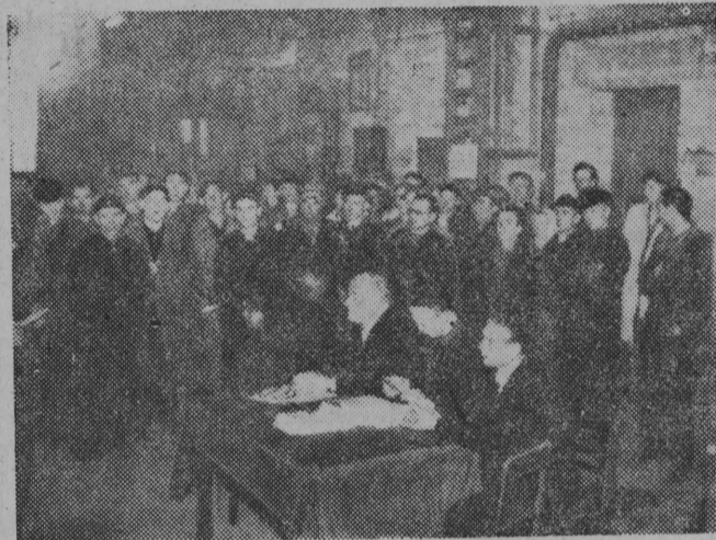
NA ZDJĘCIU: robotnicy Warsztatów Drogowych PKP w Starosielcach w czasie masówki, na której odpowiedzieli na apel CRZZ licznymi zobowiązaniami produkcyjnymi.

Jak stwierdza dziennik „New York Times” ogólna wartość akcji na giełdzie nowojorskiej obniżyła się o 14 miliardów dolarów.