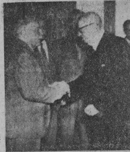
NA ZDJĘCIU: prezydent J. K. Paasikivi u przewodniczącego Rady Najwyższej ZSRR K. J. Woroszyłowa.

Z upoważnienia prezydenta Republiki Finlandii, protokół i porozumienie podpisał: premier U. Kekkonen i minister Obrony E. Skog.