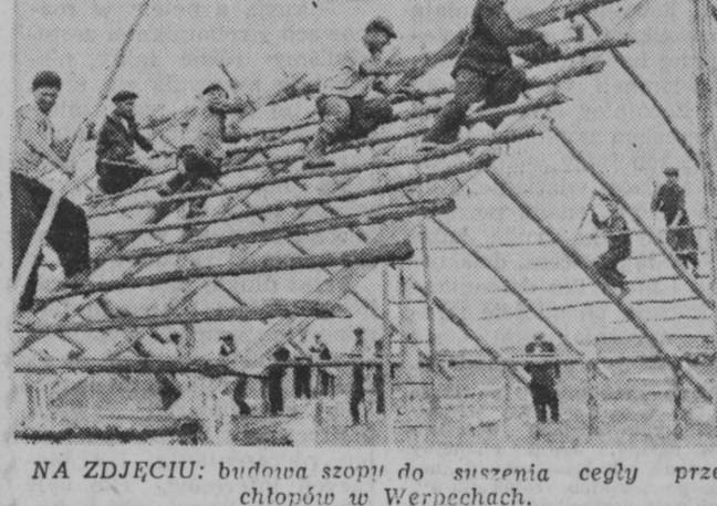
NA ZDJECIU: budowa szopy do suszenia cegły przez chłopów w Werpechach.