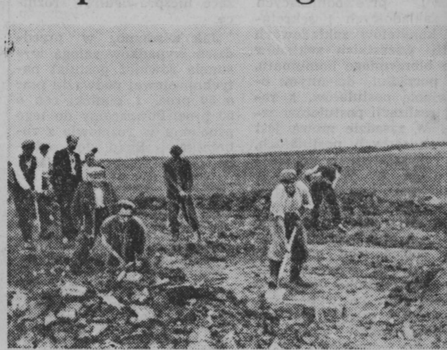
NA ZDJECIU: tu właśnie dokonuje się wykop pod piec...