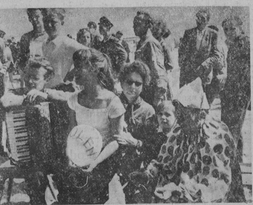
W Graal-Müritz koło Rostocku (NRF) zakończył się 7 bm. Międzynarodowy Obóz Młodzieży Krajów Nadbałtyckich. NA ZDJĘCIU: grupa młodzieży polskiej. Fot. — CAP

GDYNIA. 9 bm. opuścił Gdynię statek pasażerski „Mazowsze”, udając się w podróż do Leningradu. Na pokładzie statku znajduje się 119 uczestników wycieczki do Związku Radzieckiego, zorganizowanej przez „Orbis”. Turycy wysiadają w Tigradzie, a następnie, po zwiedzeniu tego miasta, udadzą się drogą lądową do Moskwy i stamtąd pociągiem do Warszawy.