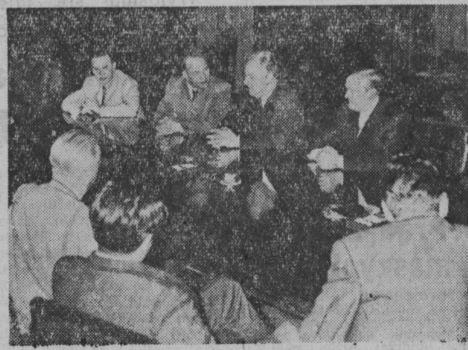
Z Jugosławii powróciła do Warszawy polska delegacja kulturalna, której przewodniczył min. Kuryluk. NA ZDJĘCIU: delegacja polska u wiceprzewodniczącego Związkowej Rady Wykonawczej — R. Colakovića.

PARYŻ. — Po długim okresie chłódów i deszczów zapanowała we Francji fala upałów. Temperatura w Paryżu wynosiła w poniedziałek 30 st. w cieniu. Najwyższą temperaturę zanotowano w Montelizar 34 st.