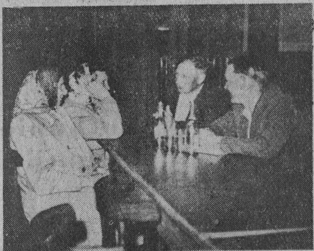
Przed wyjazdem na II Krajowy Zjazd Spółdzielczości Produkcyjnej delegaci z województwa spotkali się w sali Prezydium WRN w Białymstoku.

Eksponaty polskiej sztuki ludowej zostaną w najbliższym czasie wystawione w Edynburgu, Manchester, Halifax i innych miejscowościach.