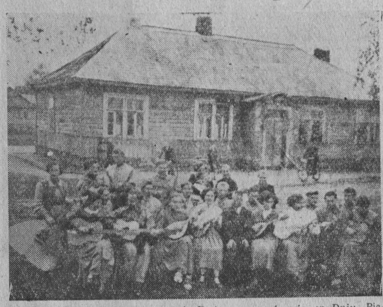
By „dobrze wypaść” w czasie Festiwalu, a następnie w Dniu Pieśni i Tańca — zespół mandolinistów WDK w Orli już teraz odbywa próby.

Ważnym w tym obchodzie Dni Oświaty, Książki i Prasy jest przede wszystkim wykład o kulturze, w którym autor wykładu wskazuje na niektóre ważne przykłady z tej dziedziny.