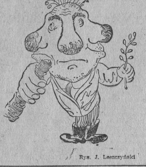
Rys. J. Leszczyński