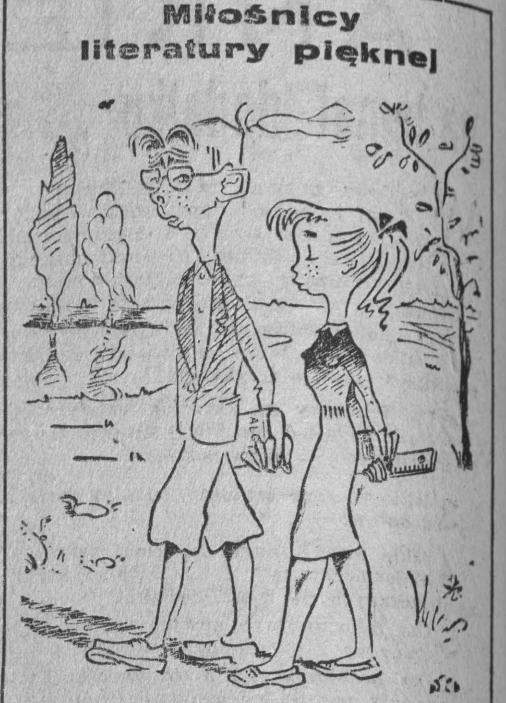
Rys. J. Gadłowski

W każdym tygodniu w parkach ruch jest gwałtowny. Leczą się w parku pod lampą flirtujący chłopcy. Dawniej jak panie spotkał chłopiec który To se oboje poszli na nieszpory. Dziś jak się ino zapozna z dziewczyną Jazda do kina.