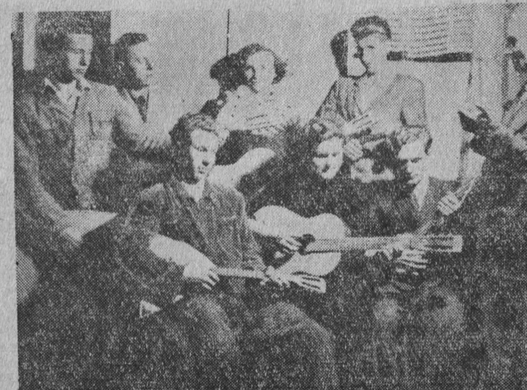
Próba zespołu mandolinistów w Wiejskim Domu Kultury w Orli. Czołowy sekstet gitarzystów i bandurzystów.

Ważnym w tym obchodzie Dni Oświaty, Książki i Prasy jest przede wszystkim wykład o kulturze, w którym autor wykładu wskazuje na niektóre ważne przykłady z tej dziedziny.