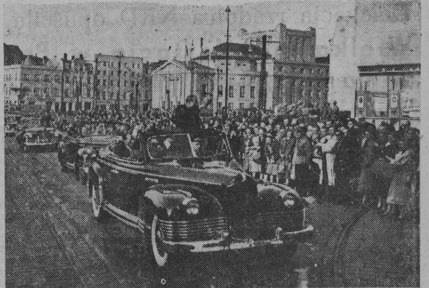
Tłumy mieszkańców Stalinogrodu witają Premiera NRD Otto Grotewohla, jadącego przez miasto.

ROK V, Nr 163 (1196) BIAŁYSTOK, poniedziałek 11 lipca 1955 r. Cena 20 gr.