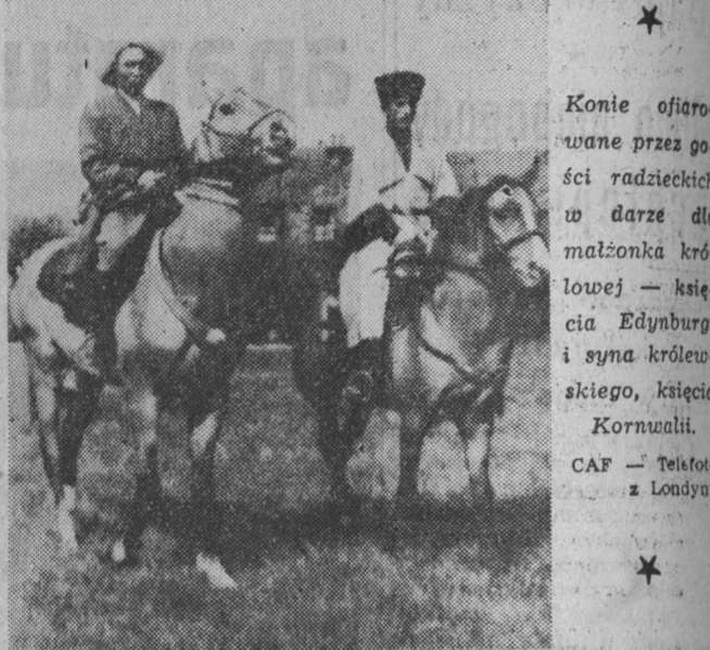
Konie ofiarowane przez polski rząd...

W tym roku już realizujemy — mówi W tym roku już realizujemy — mówi W tym roku już realizujemy — mówi