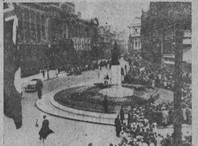
Tłumy witają gości radzieckich na City Square w Birmingham.