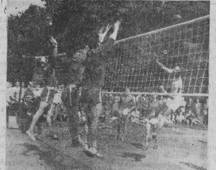
NA ZDJĘCIU: fragment spotkania Gwardia — AZS. Piłkę ścina Karasiewicz (AZS), blokując: Muszyński, Marcinkowski i Adamowicz (Gwardia).

Aktualna tabela: 1. Gwardia Białystok 4 12:3 2. AZS 1 5:3 3. Sparta Białystok 1 4:3 4. Budowlani Bielsk 1 3:3 5. Zryw Białystok 0 0:6 6. Sparta Oiecko 9 0:6