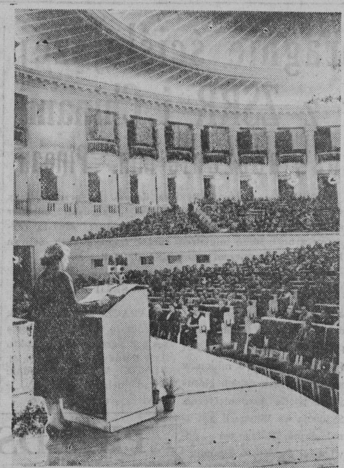
7 marca 1956 r. w Sali Kongresowej Pałacu Kultury i Nauki w Warszawie odbyła się centralna akademia z okazji Międzynarodowego Dnia Kobiet.