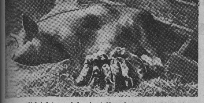
W spółdzielni produkcyjnej Nowoberezowo młoda osoba z rasy puławskiej dała w pierwszemu miocie dziewięć cieląt.