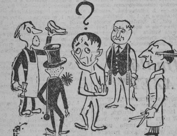
Pytanie konkursowe: który z punktów usługowych chciałby wyróżnić i dlaczego?

Kilkanaście dni temu zapoznaliśmy czytelników z regulaminem naszego nowego konkursu organizowanego wspólnie z WZSP. Dziś zamieszczamy trzeci kupon konkursowy i trzecie pytanie konkursowe. Udział w konkursie może wziąć każdy, kto w przewidzianym terminie przysłał dwa wycięte z gazety kupony — rysunki i odpowie na dwa zawarte w kuponach pytania. Odpowiedź może być zarówno pozytywna, jak i krytyczna. Odpowiedzi nadsyłają należy na adres: Redakcja „Gazety Białostockiej”, ul. Kilińskiego 15