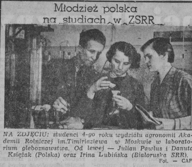
Młodzież polska na studiach w ZSRR.