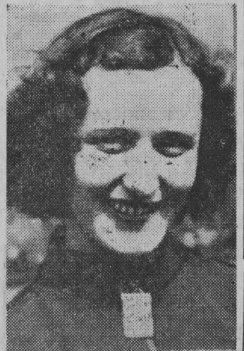
NA ZDJĘCIU: zawodniczka Białogostoku Kiczka, która w skoku wzwyż zajęła I miejsce.

MĘZCZYŹNI: 3.000 m — 1. Mosiejko (B) 9,27, 2. Wołodźko (B) 9,28, 3. Woch (Ł) 9,53, 2. Miot — 1. Świetlicki (Ł) 48,73 m, 2. Karczewski (Ł) 47,39 m, 3. Lenkiewicz (B) 44,93 m. 100 m — 1. Nikonowicz (B) 11,8 sek., 2. Durajski (Ł) 12,1 sek., 3. Zakarzewski (B) 12,1 sek. 110 ppt. — Durajski (Ł) 17 sek., 2. Bednarek (Ł) 18,3 sek., 3. Dragowski (B) 21,1 sek. Skok wzwyż — 1. Gnyś (B) 175 cm, 2. Murawski (Ł) 175 cm, 3. Siergiejewicz (B) 170 cm. 400 m — 1. Tarasiewicz (B) 51,5 sek., 2-3 Poselt (Ł) i Langowski (B) 53,7 sek. Dysk — 1. Bielski (B) 40,53 m, 2. Lenkiewicz (B) 38,53 m, 3. Kruszewski (Ł) 35,17 m. Skok w dal — 1. Jaltuszewski (B) 6,48 m, 2. Smółczyk (Ł) 6,43 m, 3. Siergiejewicz (B) 6,27 m. Oszczep — 1. Krawczyk (B) 51,97 m, 2. Urbasz (B) 47,70 m, 3. Jeżak (Ł) 46,26 m. Trójskok — 1. Piotrowski (B) 13,09 m, 2. Murawski (Ł) 13,02 m, 3. Smółczyk (Ł) 12,79 m. Sztafeta olimpijska — 1. Białystok (Dondziło, Tarasiewicz, Marczuk, Nikonowicz) — 3,29,8. 2. Łódź (Cybulski, Poselt, Jakubowski, Durajski) — 3,41,6. Kula — 1. Borowski (B) 12,40 m, 2. Kruszewski (Ł) 12,12 m, 3. Siergiejewicz (B) 11,09 m. Tyczka — 1. Bednarek (Ł) 3,50 m, 2. Niedzielski (Ł) 3,34 m, 3. Piotrowski (B) 3,00 m. (ll)