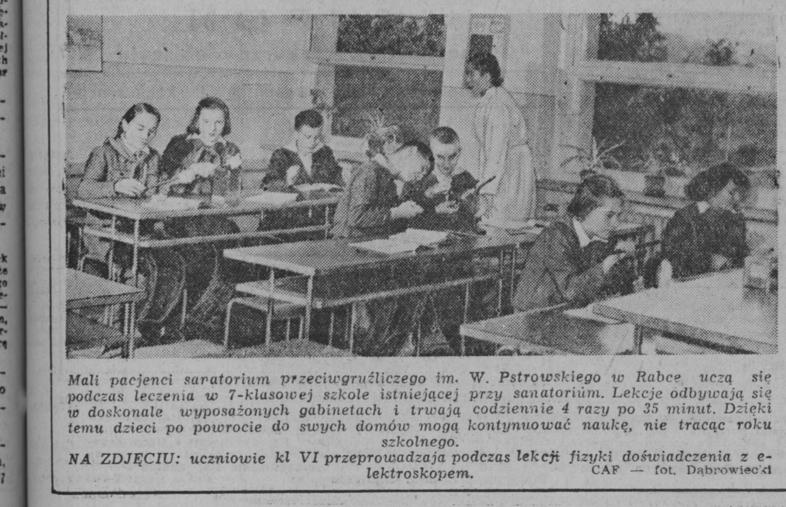
MAŁI PACJENCI satoratorium przeciwgruźliczego im. W. Pastrowskiego w Rabes uczą się podczas leczenia w 7-klasowej szkole istniejącej przy satoratorium. Lekcje odbywają się w doskonale wyposażonych gabinetach i trwają codziennie 4 razy po 30 minut. Dzięki temu dzieci po powrocie do swych domów mogą kontynuować naukę, nie tracąc roku szkolnego.