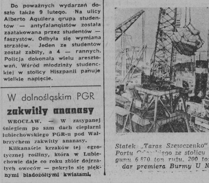
Statek „Taras Szweczenko” przywiózł do Portu Gdyniowego ze stolicy Burmy — Rangun 6 870 ton ryżu, 200 ton ryżu stanowiącego dar premiera Burmy U Nu dla ZSRR.