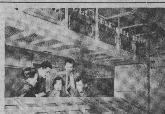
W Pałacu Kultury i Nauki w Warszawie trwają prace przy montażu urządzeń telewizyjnych.

Omawiana narada jest pierwszą z całego szeregu narad, w czasie których pracownicy naukowcy i studenci naszych uczelni radzić będą nad perspektywami i zadaniami swych uczelni w planie 5-letnim.