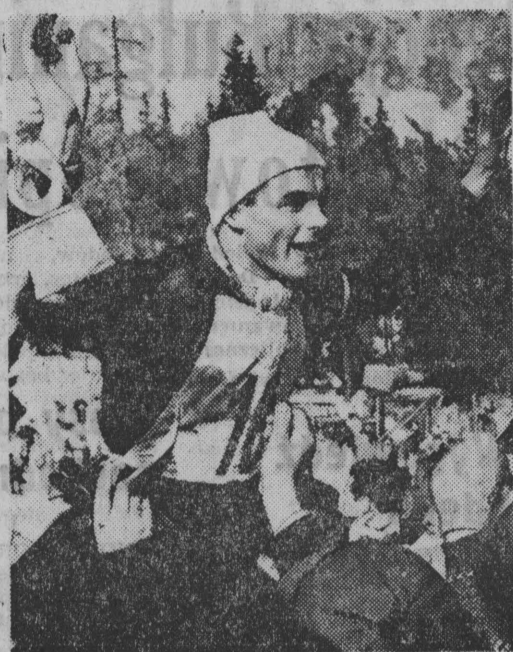
NA ZDJĘCIU: Toni Sailer (Austria) zwycięzca biegu zjazdowego zdobył trzeci złoty medal w Cortinie.