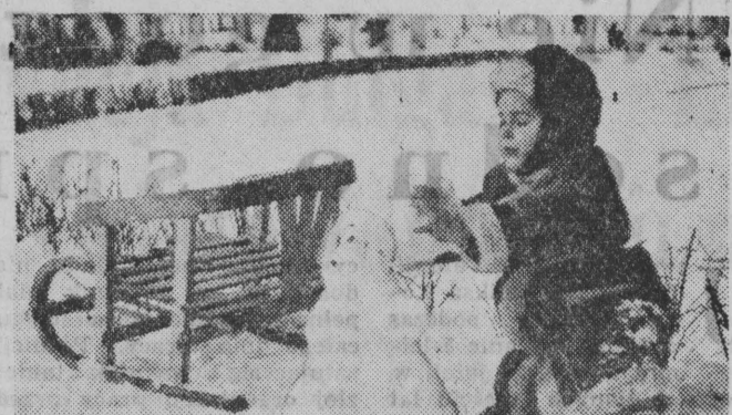
Snieg jest, więc udało mi się ulepić balawana...

To dobrze, że bardzo dobrze, że coraz więcej o sprawach „na linii”, „na bieżąco”, „szczeblu” itp., a coraz więcej używamy słów ludzkich. Wiele skłoniło do tego i o romantyzm być musi, konieczność. George Gershwin był tym, który zawrotnym rytmem jazzu pełnił estradę symfoniczną. Ale nie tylko. On również wprowadził jazz na współczesną scenę operową. I jeszcze raz nie tylko... Nazwał siebie również współczesnym romantyzmem. Czy dzięki temu, że dał prawo obywatelstwa jazzowej? Chyba nie tylko. Współczesny romantyzm, to będzie na pewno głęboka, cudowna miłość Murzyna Porgy do Bess, słodka kołysanka Clary, wzruszająca solidarność mieszkanki ubogiej dzielnicy. Współczesny romantyzm — to będzie na pewno spojrzenie na Murzyna nie jak na tanią siłę roboczą, lecz właśnie jak na człowieka zdolnego do takich smęchych drgnień duszy, jak u człowieka białego Romantyzmem wresz-