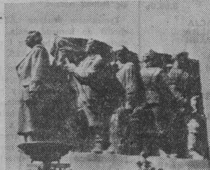
W dniu 1 maja w Pradze nastąpiło uroczyste odsłonięcie pomnika Józefa Stalina.

Chlubą i dumą narodu czechosłowackiego jest przemysł ciężki. Idąc za słusznymi wskazaniem partii i rządu, lud czechosłowacki osiągnął ogromne sukcesy w rozbudowie tej podstawy nieustannego rozwoju gospodarki.