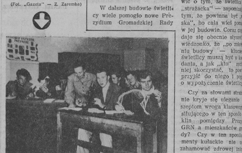
W dniu 1 maja w Pradze nastąpiło uroczyste odsłonięcie pomnika Józefa Stalina.

W dalszej budowie świetlicy wiele pomogło nowe Prezydium Gromadzkiej Rady