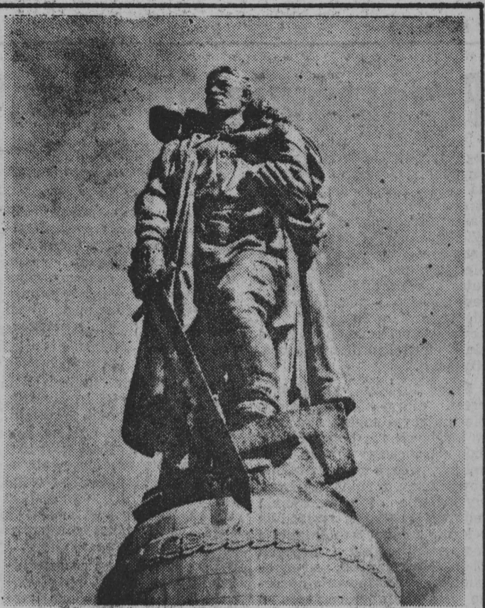
Pomnik „Zwycięzca — oswobodziciela” w Berlinie.