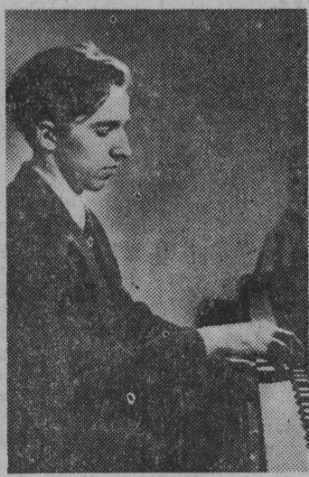
Władimir Aszkenazi (ZSRR) — II miejsce