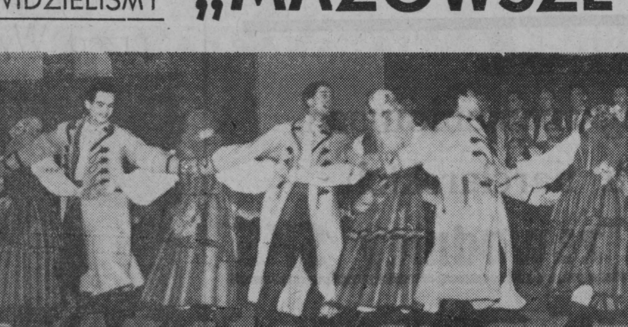
Jak pięknie można wykonać nasze staropolskie tańce, przekonali się wczoraj widzowie na występie „Mazowsza” w białostockiej hali sportowej...