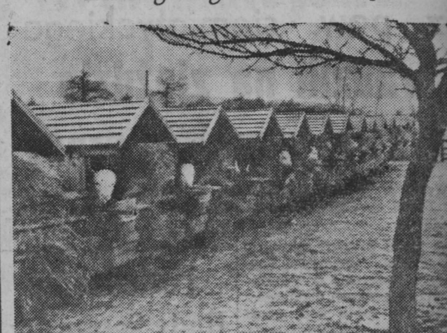
Rolnicy czechosłowacy, wzorując się na metodach radzieckich, stosują zimny wychów cieląt. Cielęta spółdzielni produkcyjnej Witinka w obwodzie pilzneńskim hoduje się w nieogrzewanych budkach...