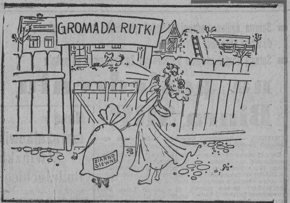
Wiosna puka do bram gromady Rutki. Puka do bram całej wsi białostockiej...

Nasz fotoreporter utrwalił na taśmie kilka fragmentów przygotowań do siewów w zambrowskiej gromadzie Rutki i oleckiej — Stożne.