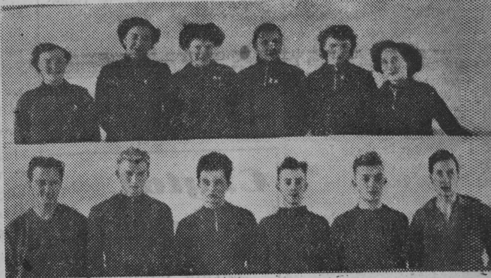
W niedzielę zakończyły się w Białymstoku wojewódzkie międzypartowe rozgrywki w siatkówce kobiet i mężczyzn o Puchar CRZZ. NA ZDJĘCIU: u góry — zawodniczki Kolejarza Białystok, które zajęły drugie miejsce, u dołu — zdobywcy pierwszego miejsca, siatkarze Sparty Białystok.