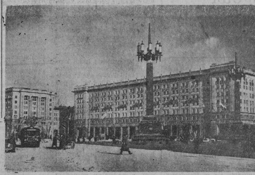
Warszawa w zimie

MOSKWA. - Na Kaukazie północnym kolchozy i sowchozy przystąpiły do wiosennych prac polowych i siewu o miesiąc wcześniej niż w roku ubiegłym. W Azji Środkowej, gdzie zima tegoroczna jest niezwykle łagodna, prace polowe oraz roboty w sadach trwają bez przerwy.