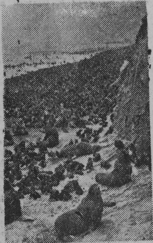
Foki, zwierzęta bardzo cenne ze względu na tłuszcz i futra, żyją masowo na wyspach Morza Ochockiego.

NA ZDJĘCIU: Wyspa Focza na Morzu Ochockim (ZSRR)