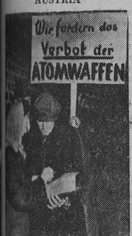
NA ZDJĘCIU: Mieszkańcy robotniczego przedmieścia Wiednia - Liesing składają podpisy pod apelem Światowej Rady Pokoju przeciwko broni atomowej.

Na całym świecie rozpoczęła się akcja zbierania podpisów pod apelem ŚRP