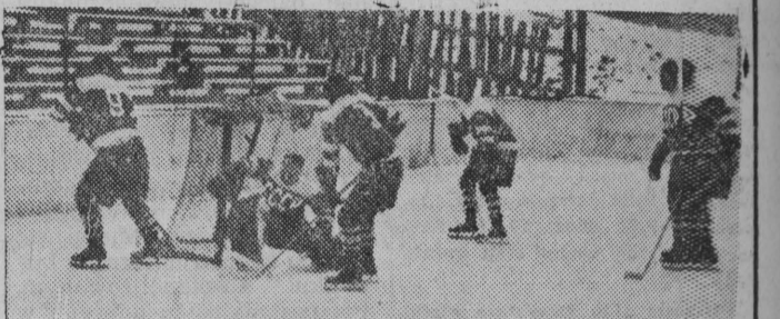
Drużyna ZSRR, mistrz świata w hokeju na lodzie, podczas treningu w Warszawie na Torwarze.