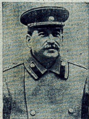
Wódz Naczelny Czerwonej Armii Marszałek Związku Radzieckiego J. W. STALIN