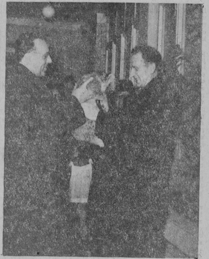
Przybyła na obchód X rocznicy wyzwolenia Warszawy delegacja NRD przywiozła w darze dla stolicy Polski 8-tygodniowe lwiatko. Młoda lwica została przekazana warszawskiemu ZOO.

Trzeba jednak stwierdzić, że zarówno inwestor jak i wykonawca — BPZB, nie zabezpieczyli nadsyłanych maszyn przed niszczącymi opakowanie warunkami atmosferycznymi. Zamiast wzajemnie zwać na siebie winę za ten stan i dyskutować, czym obowiązkiem jest zabezpieczenie przesyłek, przekonują się, że brak desek, trzeba natych-