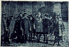
RYGA DZISIAJ. Wesółka promaska powraca do życia socjalistyczna w obłokach. Podczas okupacji niemieckiej dotężył się powalony motocykl naziści. Hierodicy zamienili prawie wszystkie sikoty na koszary.