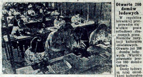
W dział lamp radiowych, Moskiewskich ordera Lenina zakła- dów lamp elektrycznych.

Iwanowski fabryki włókiennicze ukończył przed terminem roczny program wytwórcy. W roku 1944 także Iwanowski wyprodukowali o 20 milionów m. materiału więcej, aniżeli w r. 1943.