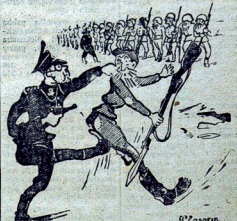
GENERAL SS — Marz na front! Przewóz szkolono was już całe 8 godzin! Rys. P. ZASORINA.

Amerykańskie oddziały wzięły do niewoli grupę jeńców ze składu hitlerowskiego „Volkssturmu”. Są to żołnierze w wieku 45 — 50 lat, którzy przed wysłaniem na front przeszli 8 godzinne przeszkolenie. (Z. gasc)