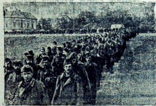
W kierunku Budapesztu. Waleci do niewoli niemiecy i węgierscy żołnierze odprawiani są na tył.