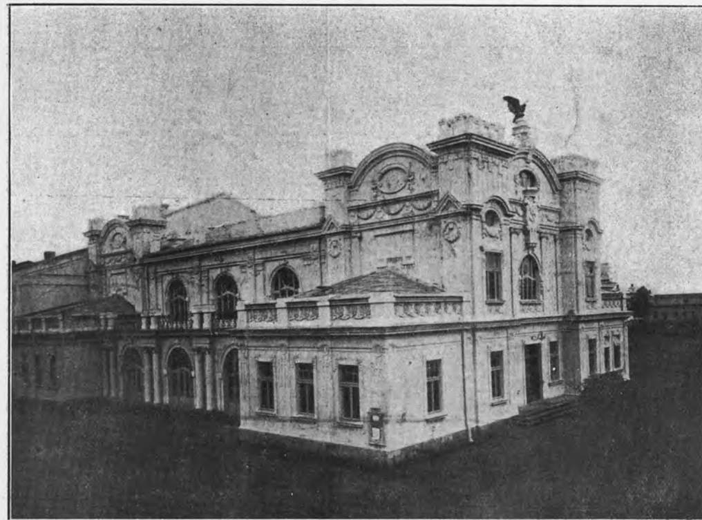
Fot. 1. Gmach Sokola.