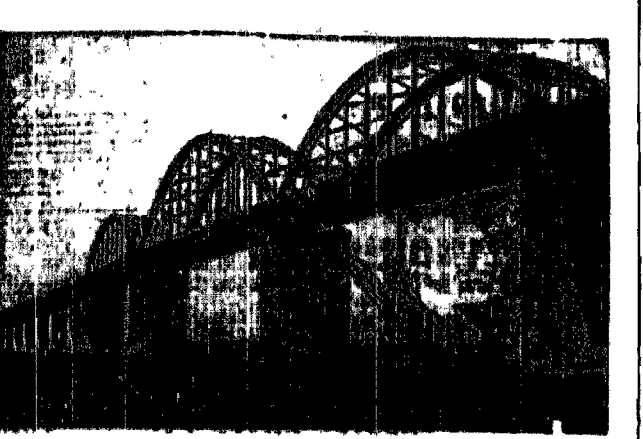
Najdłuższym mostem w Europie jest most łączący wyspę Seeland z Dalią.