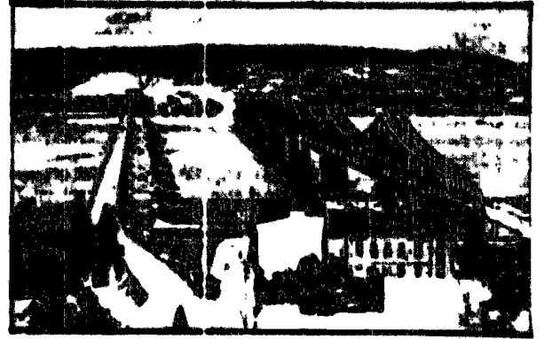
Widok z miasta Włocławka na 3 mosty i na przedmieście Szpital Dobry.