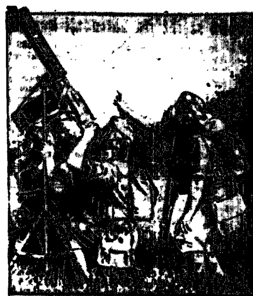
W Aldershot w Anglii, rozpoczęły się wielkie manewry armii angielskiej, w których ważną rolę odegra lotnictwo. Na zdjęciu widoczne są żołnierze w maszynach gazowych.