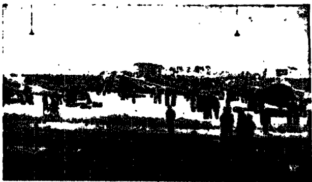
Tegoroczne święto narodowe Francji będzie miało, jak wiadomo, charakter wielkiej manifestacji wojskowej. W związku z tym na lotnisko Le Bourget przybyło już 5 eskadr samolotów angielskich najnowszej typu pod naczelnym dowództwem szefa sztabu sił powietrznych Anglii, Playfah. Na zdjęciu - widok na lotnisko Le Bourget w momencie lądowania angielskich samolotów.