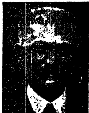
Prezydent Francji Lebrun.