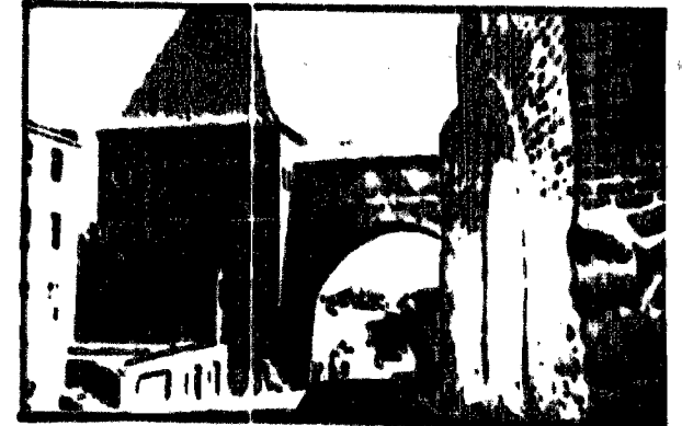
Wnętrze sali w hotelu...