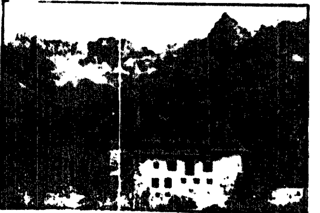
Schronisko P. T. T. na Ha i Gajdencówce na tle wspaniałej panoramy gór od stoków Świnicy po Granatę.

zamordował sekiera. odmawiając jej wszelkich wyjaśnień.