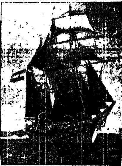
„Jadrana“ w porcie gdyńskim.

wizytowało na „Jadraniu“ swych kolegów jugosłowiańskich, którzy ich następnie odwiedzili w Okazywlu.