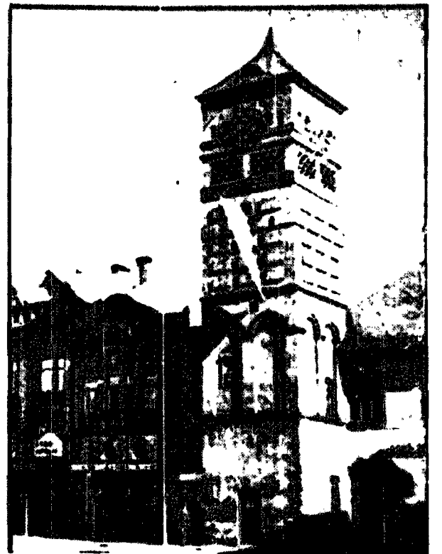
Frysztal - Ratusz z XVI w. z godami Piastów.