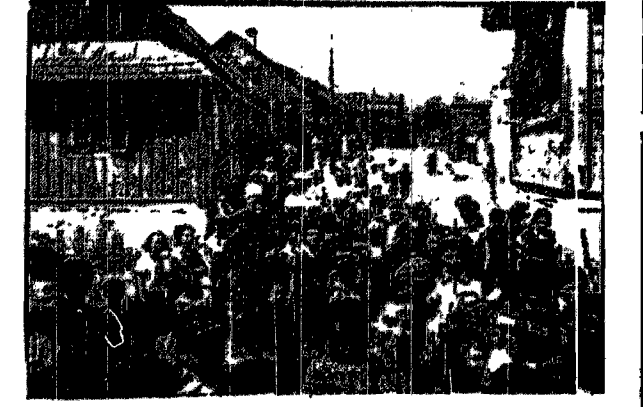
Jedna z ulic „Wenecji” w Tomaszowie Lubelskim z gromadą żydowskich dzieci.