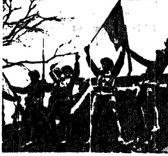
Japońscy żołnierze entuzjastycznie odwołują radość z powodu zwycięstwa.