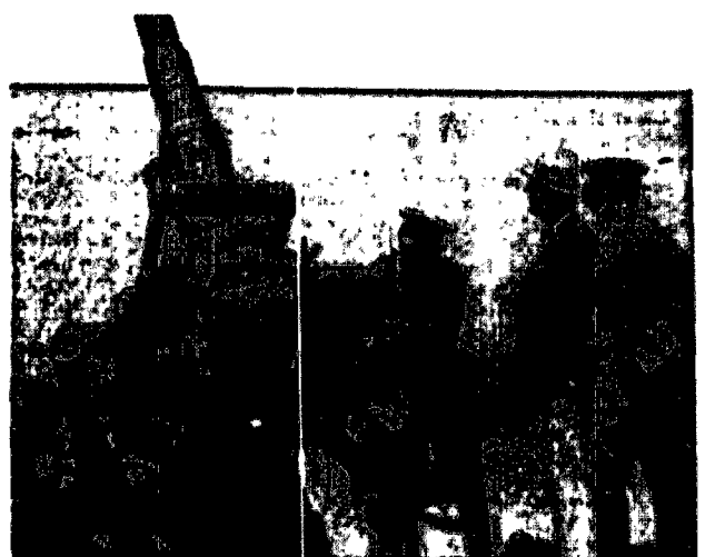
Amerykański minister wojny ogląda ciężkie działko przeciwlotnicze najnowszej typu