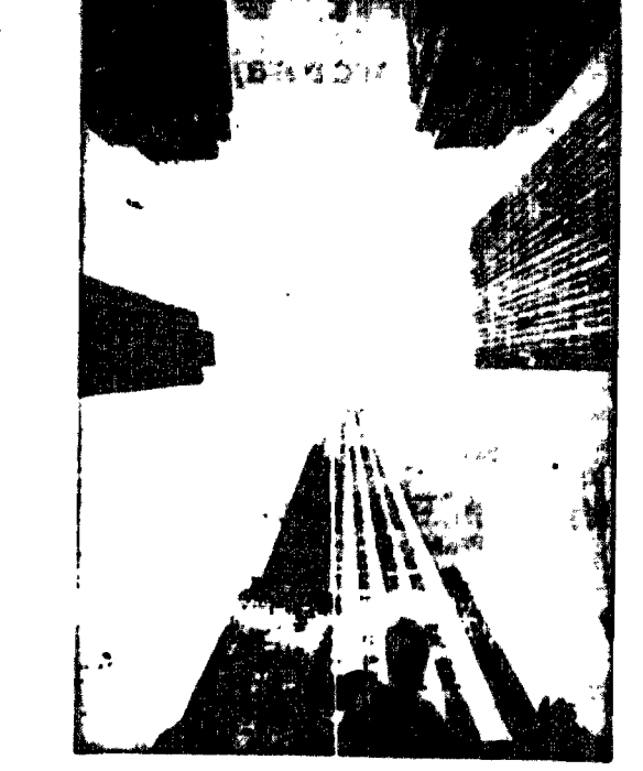
Widok z ulicy na szczyty wznoszących się Nowego Jorku