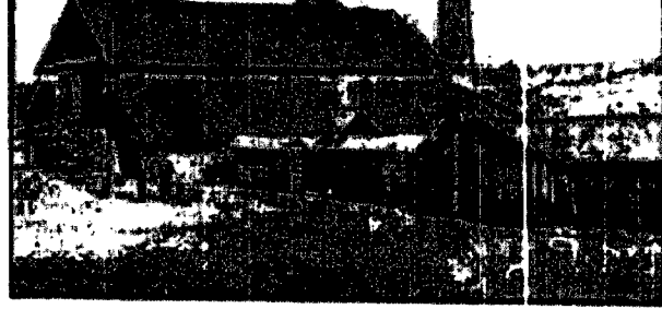
Klinkierowa gmina w Sieniatynie.