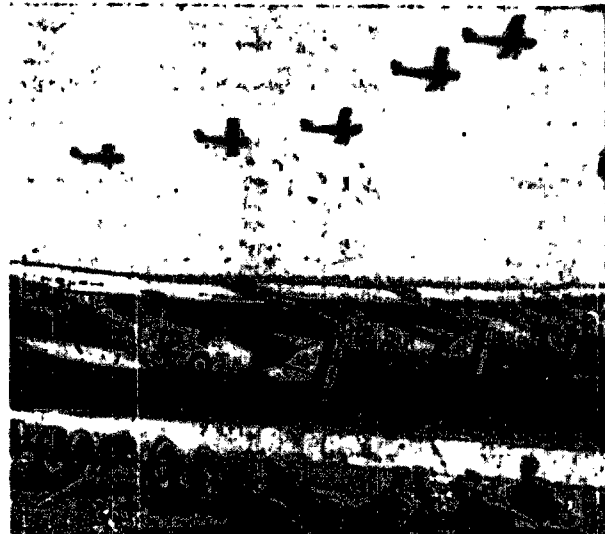
W ramach wiekowych manewrów armii brytyjskiej, które odbędą się w sierpniu br. prowadzone są obecnie treningi samolotów wywiadowczych.