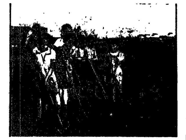
Od szczęśliwych lat zaprawdą się w rolniczym zawołaniu.