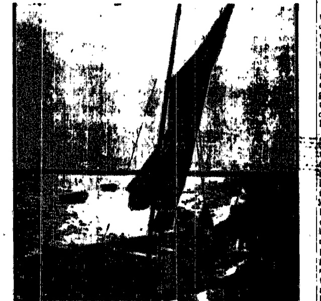
Świt nad Bałtykiem.