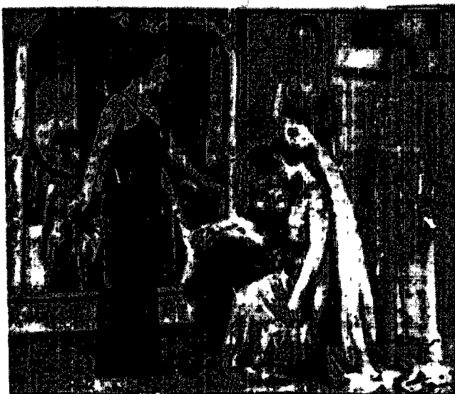
Roześmianie na początku lata odbywa się w Londynie wielkie przyjęcie dworskie. Przed przyjęciem młode lady ćwiczą się pilnie w tańcach.

W r. 1702 przy ujściu rzeki Rio Grande do setki Vigo porzucono flota angielsko - holenderska gotowała 16 okrętów hiszpańskich, która w składzie 18 okrętów wróciła do kraju z wielkimi ładunkami złota, srebra i drogich kamieni.