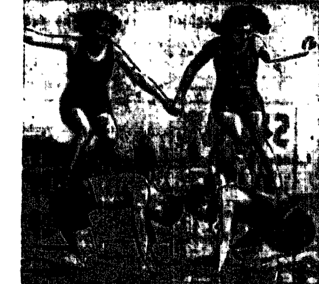
Fala upałów, jaka nawiedziła ostatnio Europę spowodowała, że plażę stęży się niezwykle powodem. Oto wesoły obrazek plażowy w jednej z francuskich miejscowości nadmorskich.