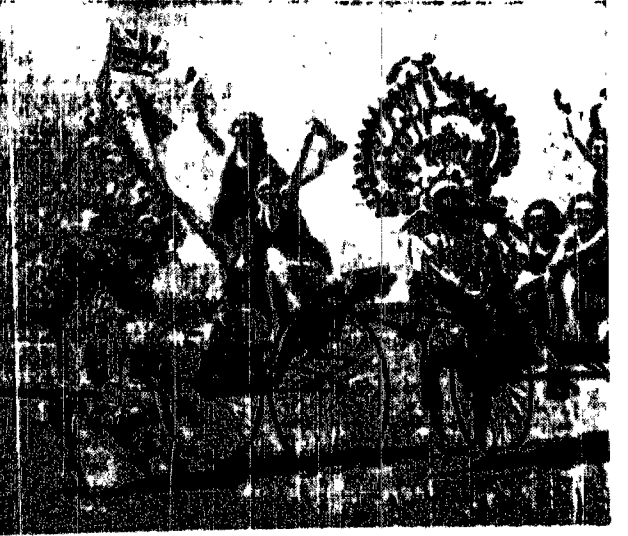
Wycięgi fitness na plaży w Durban na wybrzeżu Południowej Afryki. Pasażerami tych oryginalnych pojazdów, ciągniętych przez Żulbów są urocze miś, szukające ochłody przed palącym promieniami afrykańskiego słońca na otoczonej plaży.

Imierant niemiecki Kethaus skonstruował aparat, dzięki któmu można było, że gdy skierowano je na stać krów, sьwarożę nęcyłmnie pały bez żywc. Kethaus, który odkarował swój wynalazek rządowi francuzkiemu, twierdzi, iż w przyszłej wojnie stanie się on je-