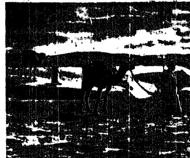
Rząd francuski postanowił zasadzić na Saharze na odległości 2000 km 16.000.000.000 drzew, aby w ten sposób zabezpieczyć Afrykę Północną przed dalszym posuwaniem się piaszków pustyni.