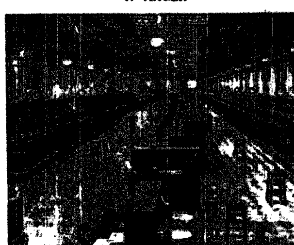
W Birmingham wybudowano kosztem 600.000 funtów olbrzymią międzydomową centralę telefoniczną.