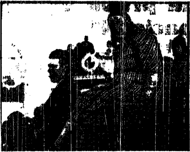
Punkt obserwacyjny na balkonach z towarem

Na przystanku gruchnęła wiadomość: Nie ma specjalnego statku, wszystkie piosny na Dielony!