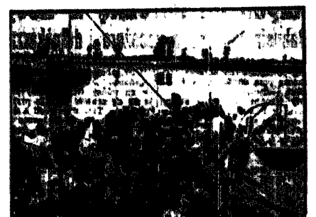
Nie dla wszystkich starczyło miejsca...