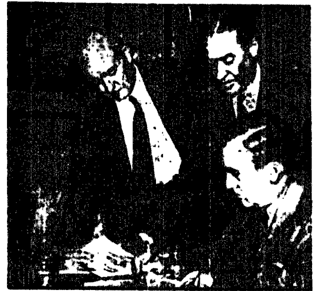
Minister marynarki Stanów Zjednoczonych podpisał czek na 350 mln. dol. przeznaczony na rozbudowę floty.