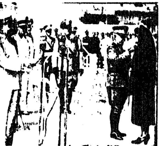
Król włoski Włtor Francuzi udzielał wdowom po poległych marynarzech odznaczeń wim wojennym.