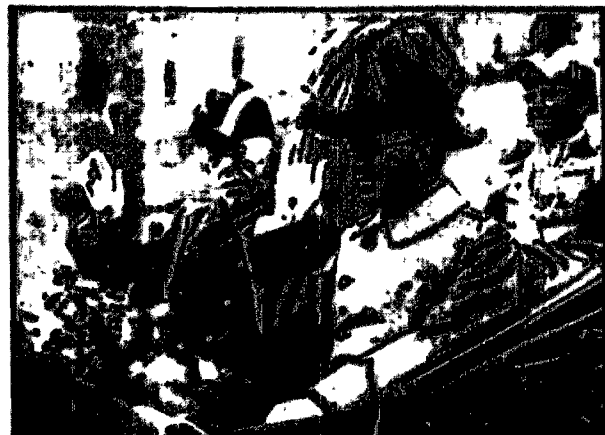
Król szwedzi Gustaf V w towarzystwie następcy tronu Gustawa Adolfa udaje się na uroczyste posiedzenie parlamentu.