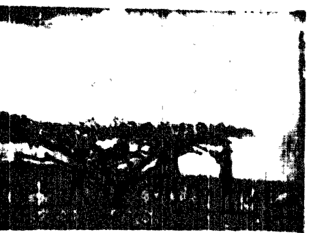
Gdy dobiegł wypalił trawę, zwierzę obrzyło kłose łusowatych drzew.