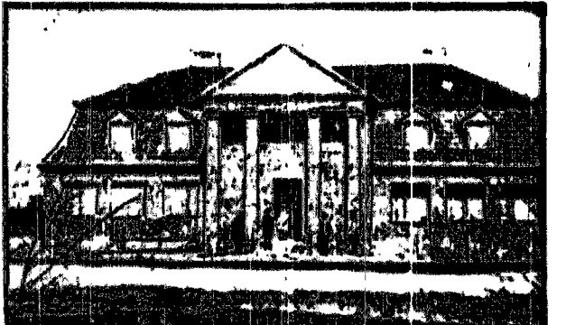
Szkoła powszechna w Chodosach pow. kobryński.

Przebiegiem roku zapowiedział sumiennie w prasie ukazanie się pamiatkowej kalendarz p. l. „Geniusz Niepodległości“.