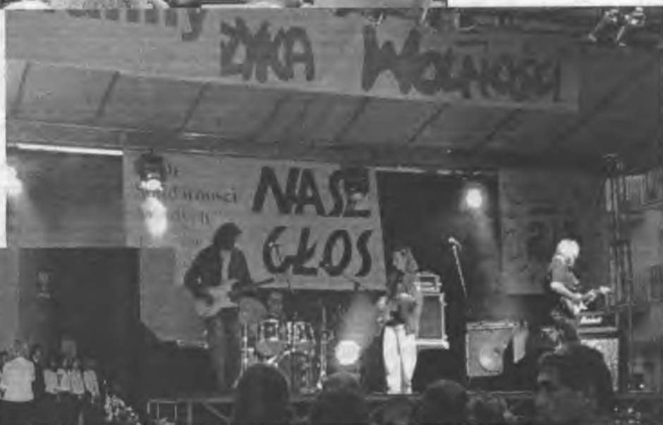
Młodzież z Gimnazjum w Mońkach w spektaklu słowno-muzycznym przypomniła najnowszą historię Polski.

„Muzyka Wolności” to był koncert rocznicowy solidarności młodych, m.in. NZZ-u i „Naszego Głosu”. Na scenie Kasa Chorych.