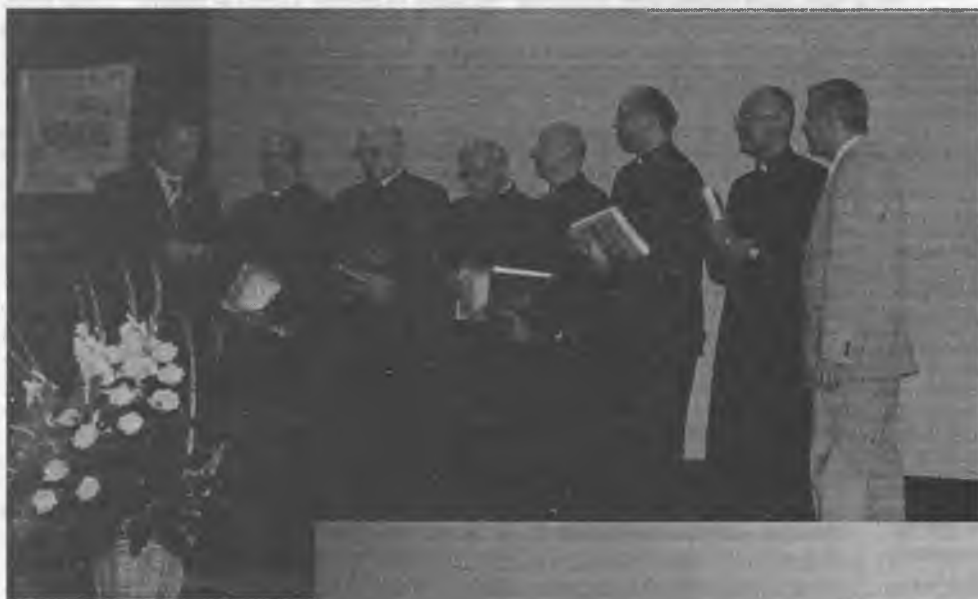
Kapłani zasłużeni dla NSZZ „Solidarność” otrzymali podziękowania i dyplomy.