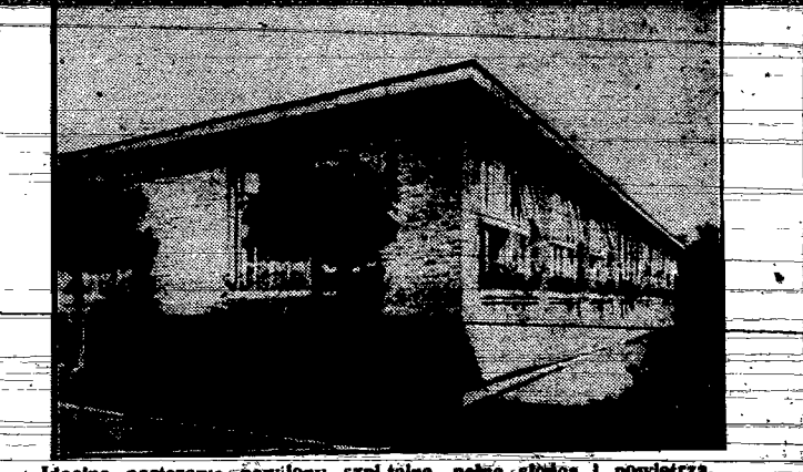
Idealne parterowe pawilony szpitalne, pełne słońca i powietrza.